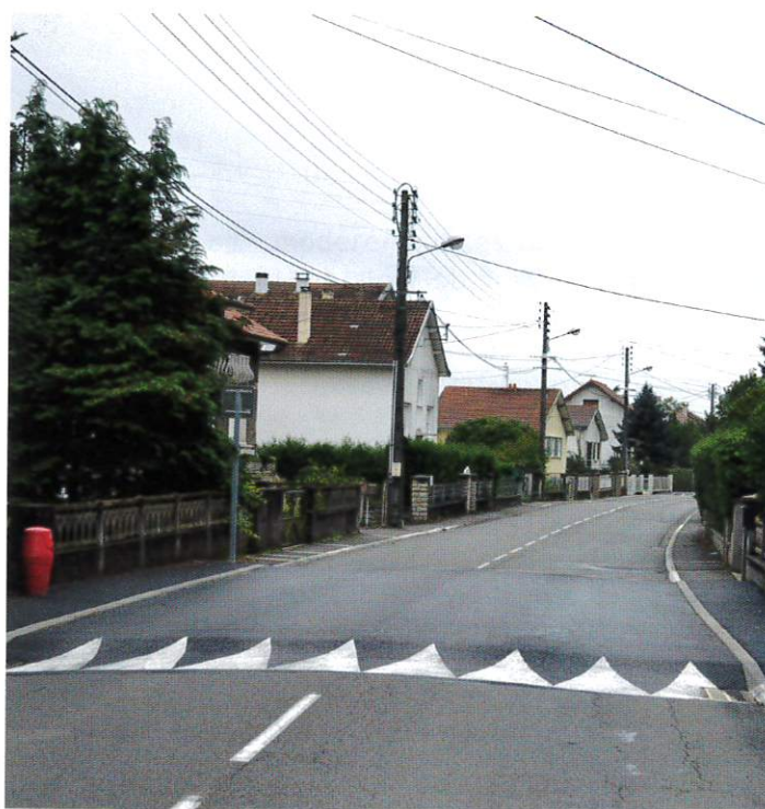
Plateau rue de Courcelles.