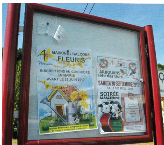
Nouveaux panneaux d'affichage.