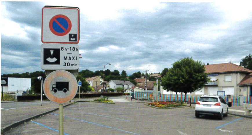
Nouvelle réglementation sur le parking de l'école et ouverture du parking de la SED ont facilité la vie des parents d'élèves.