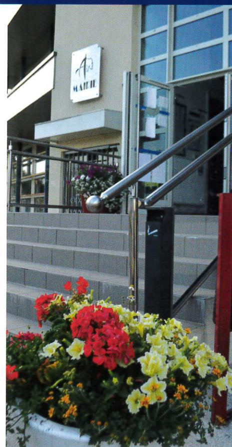
Fleurissement de la Mairie.