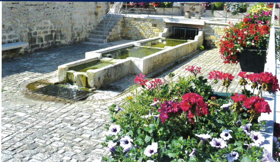
Fleurissement de la fontaine.