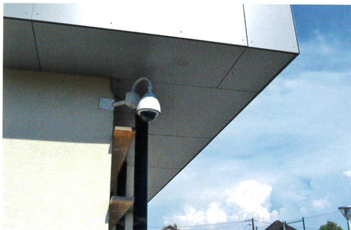
Vidéo-surveillance sur le site de la Mairie.

Cette année, nous avons étendu cette vidéo-surveillance derrière le chalet du Tennis-Club et sur la piste cyclable.