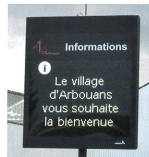
Panneau d'affichage numérique.