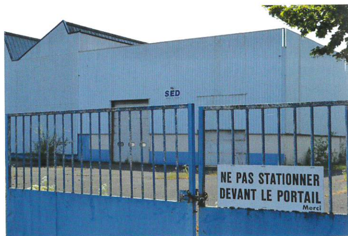
Les bâtiments de la SED sont voués à démolition prochaine.

Nous avons toujours des projets en tête, mais des priorités devront être définies en fonction de nos possibilités financières. Certaines idées, comme par exemple la fermeture du site environnant la Mairie, ont été abandonnées en raison de leur coût.