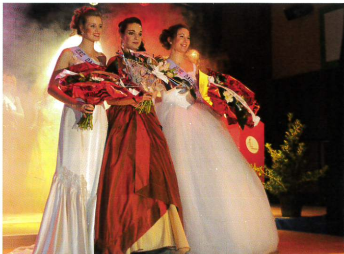
L'élection de Miss Arbouans est devenue un événement qui a dépassé le cadre du village.