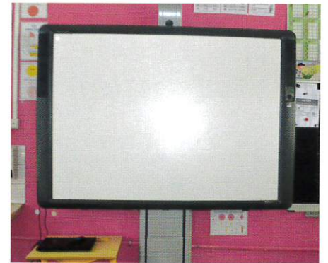
Tableau blanc interactif.