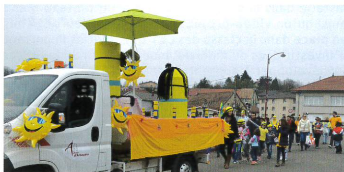
Carnaval en commun avec la ville d'Audincourt.