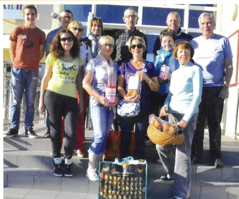
Le groupe des bénévoles avant la distribution.

Merci à tous les généreux donateurs ainsi qu'aux personnes qui ont assuré la distribution des brioches.