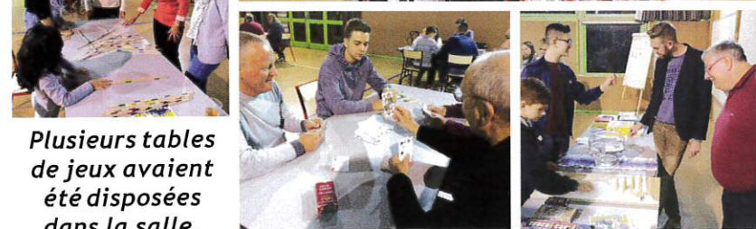
Plusieurs tables de jeux avaient été disposées dans la salle.