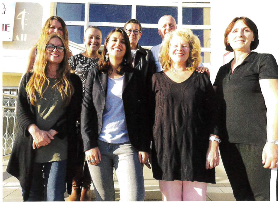
Les enseignants et le personnel scolaire ont été reçus en Mairie.