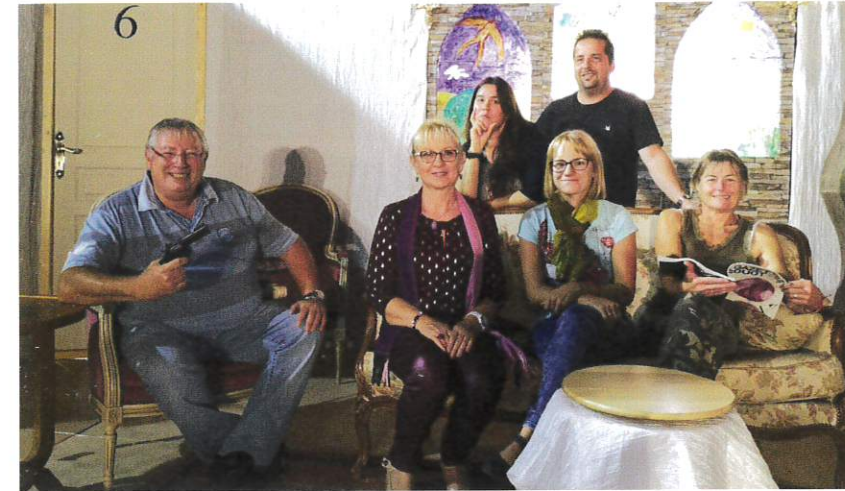
Les organisateurs dans le décor des «Allenjoyeux Drilles».