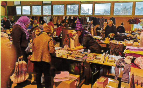
Belle affluence à la Salle polyvalente.

La brocante du club de tennis de table fait toujours recette ! En ce 11 novembre, dans une salle comble, les chineurs ont défilé tout au long de la journée et les bénéfiques ont permis au club d'étoffer son budget.