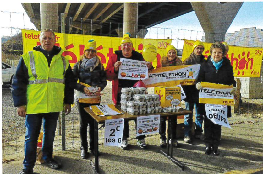
Vente d'œufs rue des Ecoles le matin...

Chaque année, la Commission CSA (Culture, Sports et Associations) innove pour le Téléthon. Afin de grossir la cagnotte destinée à l'AFM (Association Française contre la Myopathie), deux opérations distinctes ont été organisées sur la commune le 1 er décembre, une semaine avant la date officielle du Téléthon. Le matin, sur la rue des Ecoles, une opération de vente d'œufs (fournis gracieusement par la ferme Brand de Mandeuire) a été proposée aux automobilistes. En fin de matinée, les soixante douzaines d'œufs disponibles avaient trouvé preneurs. Puis, le soir, la Commission CSA s'est rendue à la salle de la chapelle pour proposer des soupes, toujours au profit du Téléthon. Pour ces deux opérations, une somme de 498,27 € (dont 52 € de vin chaud par le Comité des Fêtes) a été recueillie et transmise à l'AFM.