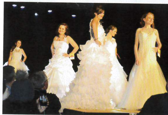
...et le plus beau, en robes de mariées.