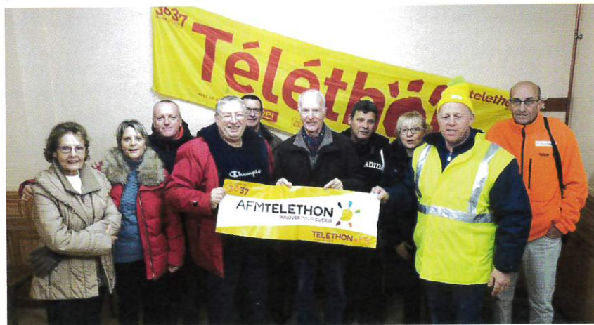
... et vente de soupes à la chapelle le soir.

Chaque année, la Commission CSA (Culture, Sports et Associations) innove pour le Téléthon. Afin de grossir la cagnotte destinée à l'AFM (Association Française contre la Myopathie), deux opérations distinctes ont été organisées sur la commune le 1 er décembre, une semaine avant la date officielle du Téléthon. Le matin, sur la rue des Ecoles, une opération de vente d'œufs (fournis gracieusement par la ferme Brand de Mandeuire) a été proposée aux automobilistes. En fin de matinée, les soixante douzaines d'œufs disponibles avaient trouvé preneurs. Puis, le soir, la Commission CSA s'est rendue à la salle de la chapelle pour proposer des soupes, toujours au profit du Téléthon. Pour ces deux opérations, une somme de 498,27 € (dont 52 € de vin chaud par le Comité des Fêtes) a été recueillie et transmise à l'AFM.