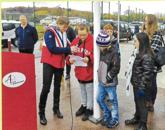
Les enfants ont procédé à l'appel aux morts au monument.

Le 11 novembre dernier, la commune d'Arbouans a célébré le centenaire de l'Armistice de la guerre 1914-1918.