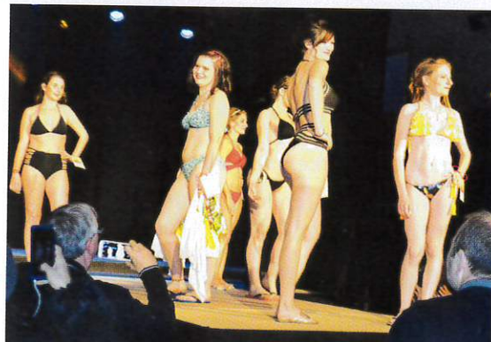
Le passage attendu des maillots de bain...