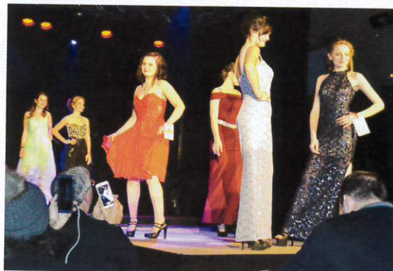
Les Miss en robes de soirée.