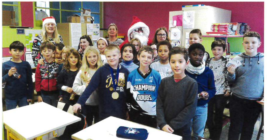
Dans la classe de CM1/CM2.