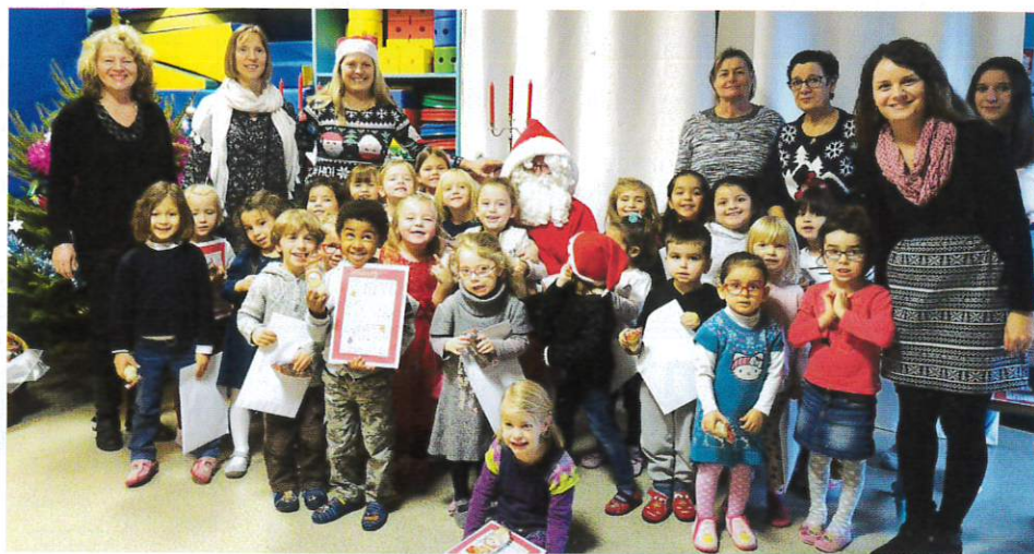
A la maternelle.

Comme chaque année, le Père Noël est passé à l'école juste avant les vacances pour offrir des cadeaux.