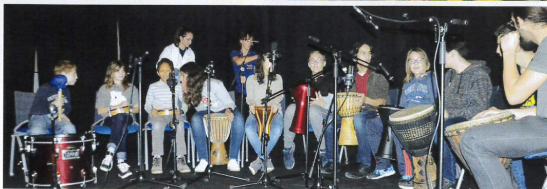
Les chants des plus jeunes et les percussions des ados.

E n novembre, les jeunes du péricolaire ont offert une soirée musicale à leurs parents. Les plus jeunes ont interprété des chants sur le thème des droits de l'enfant, puis les ados ont montré leur talent aux percussions. Cette soirée s'est poursuivie par un karaoké.