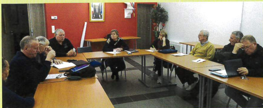
Dernière réunion des référents de quartiers pour le mandat en cours.

Dans un premier temps, les élus recherchent des «bras» pour effectuer quelques menus travaux de rénovation dans cette salle (notamment de la peinture). Le local sera ensuite aménagé avec des rayonnages qui accueilleront des ouvrages et la structure, qui serait ouverte un ou deux samedis matin par mois, pourrait être un lieu d'échanges et d'animations, un mini-marché étant également à l'étude.. Nous y reviendrons.