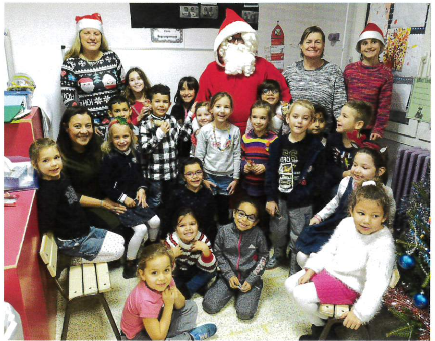
Dans la classe de CP/CE1.