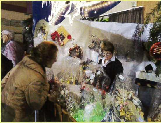
Noël avant l'heure avec le Marché.

Le traditionnel Marché de Noël organisé par le Comité des Fêtes a recueilli son succès coutumier les 1 er et 2 décembre. Près d'une vingtaine d'exposants ont proposé leurs créations dans une chaleureuse ambiance de fêtes de fin d'année.