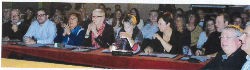
Le jury a eu une tâche difficile...