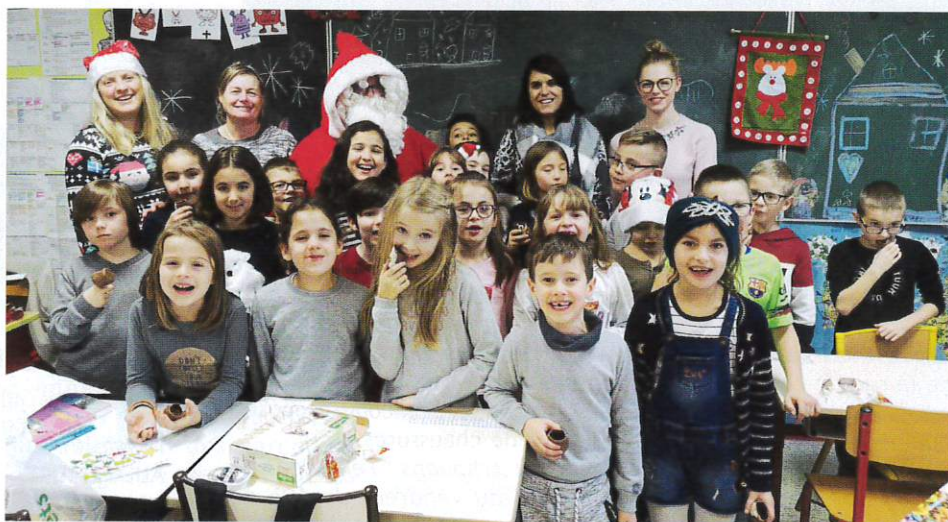
Dans la classe de CE2/CM1.

A l'école maternelle, le Père Noël a été particulièrement sollicité... même s'il a parfois impressionné les plus petits !