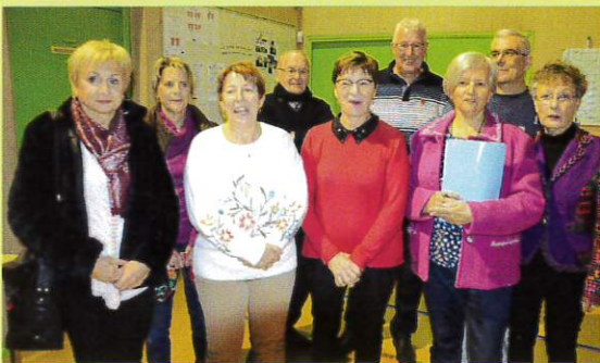
Le comité de la nouvelle association.

Avec «Sport-Seniors-Santé», une nouvelle Association est née à Arbouans. Cette association a pour but de donner la possibilité aux retraités de pratiquer plusieurs disciplines sportives adaptées à leurs possibilités (randonnée pédestre, marche nordique, cyclotourisme, gymnastique,...).