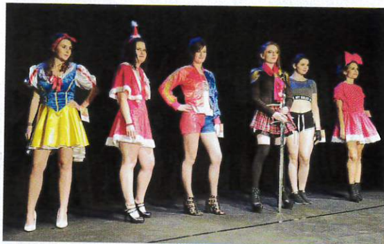
Défilé en tenues originales...