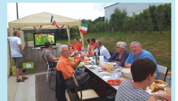
Repas amical... et match de foot à la télé !

Une bonne ambiance a régné autour du barbecue... et de la télé, puisque le fil rouge de la soirée a été France - Roumanie, le match d'ouverture de l'Euro 2016 de football.