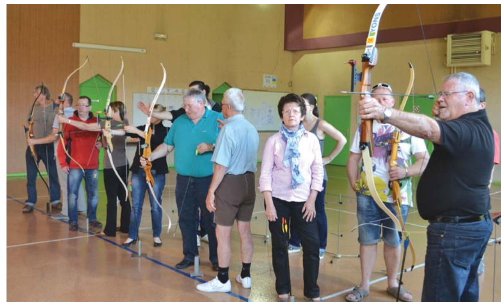
Initiation au tir à l'arc pour les élus d'Arbouans.

Tout naturellement, cette rencontre s'est poursuivie autour d'une collation conviviale.