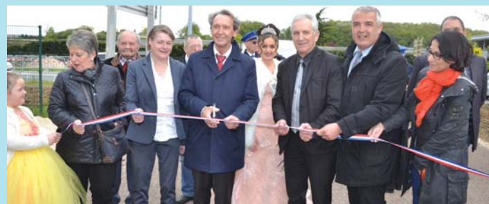
L'inauguration officielle de la fête...

La fête foraine d'Audincourt était un peu celle d'Arbouans cette année puisque, pour la première fois, la cité croq'rave a abandonné sa Place du Marché, en pleine rénovation, pour organiser la fête foraine. C'est sur l'aire des gens du voyage, à cheval sur Audincourt et Arbouans, route du Redon, que les forains ont proposé leurs attractions pendant deux semaines.