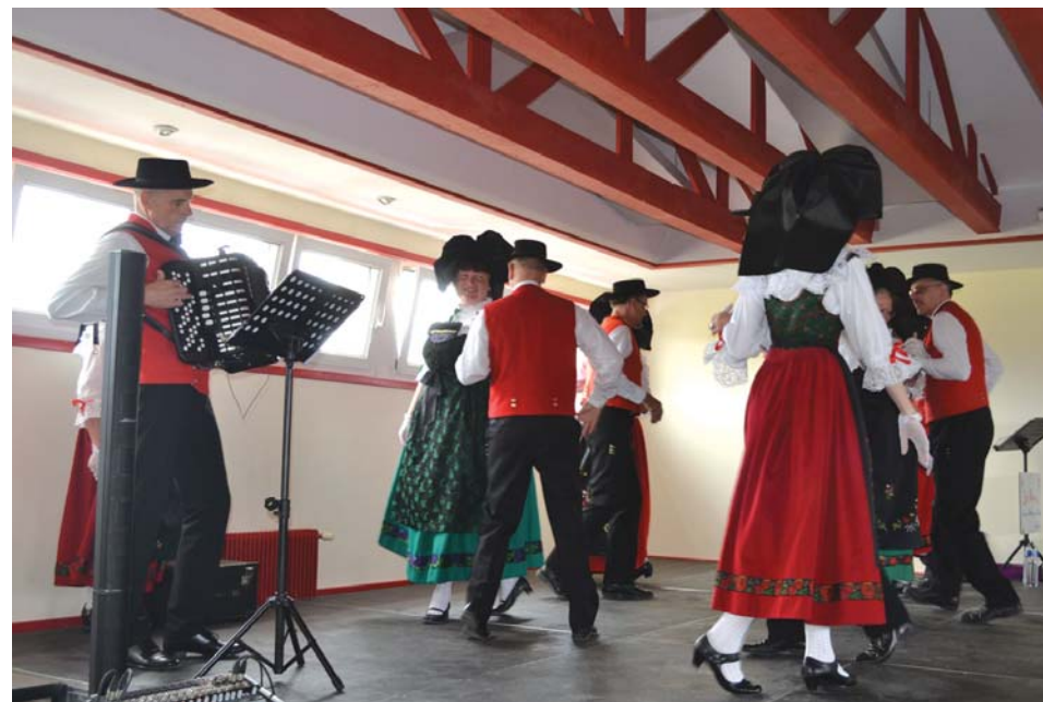
«Les Barrois» ont fait l'unanimité à la Salle des Fêtes d'Arbouans.

La Municipalité et Fest'Arbouans ont profité du passage dans le Pays de Montbéliard du groupe folklorique «Les Barrois», venus de Barr