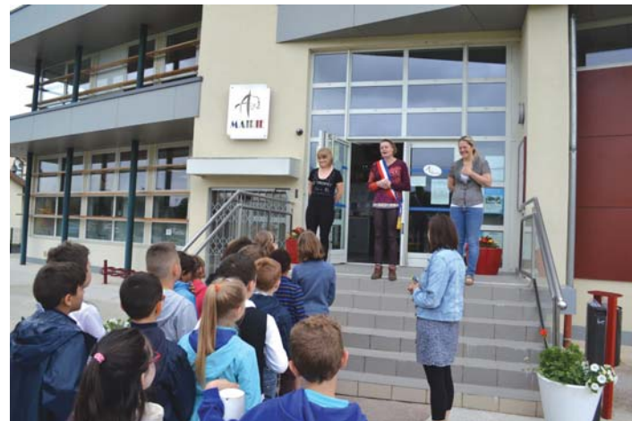
Les élèves de Cours élémentaire accueillis sur le perron...

L'année dernière, les écoliers avaient passé une matinée en Mairie afin de participer à une «vraie-fausse» élection. Cartes électorales, bulletins de vote, isoïr, urne... et dépouillement, les jeunes avaient reçu un vrai cours d'instruction civique !