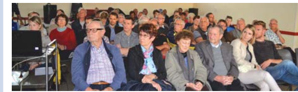
L'affluence était au rendez-vous pour la première réunion (55 personnes), elle fut plus restreinte lors des deux autres réunions (6 puis 18 personnes).

Compte-rendu des réunions de quartiers consacrées au projet de la SED.