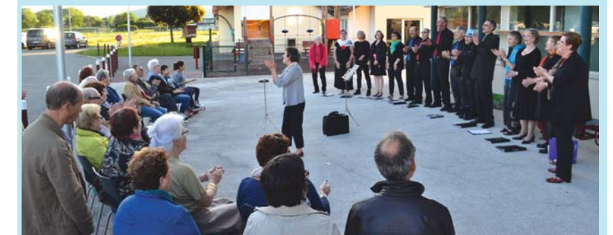
Les choristes de l'ensemble ABC ont communiqué leur passion du chant.

Le soir de la Fête de la Musique, à l'invitation de la Municipalité, la chorale ABC (Aimer, Boire et Chanter) d'Arbouans est venue offrir une aubade sur le parvis de la Mairie. Une quarantaine de personnes ont assisté à ce mini-concert très apprécié qui s'est poursuivi de façon conviviale autour du verre de l'amitié.