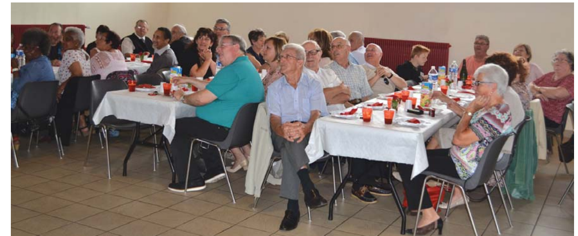
Les participants n'ont pas regretté leur déplacement.