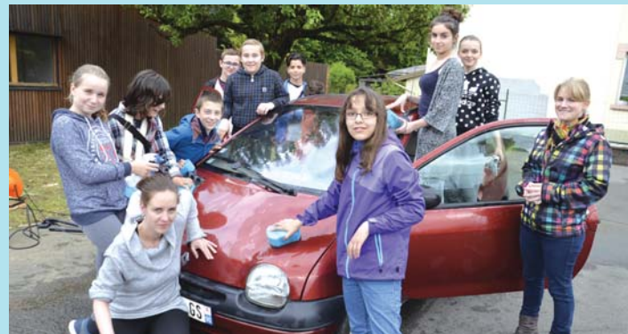
Les jeunes ont retroussé leurs manches...

Afin de financer un projet, en l'occurrence une visite du Parlement européen de Strasbourg, les ados du Club des Oursons ont organisé une opération de lavage de voitures. Pour un tarif modique (6 €), les jeunes proposaient un lavage complet des véhicules (extérieur et intérieur).