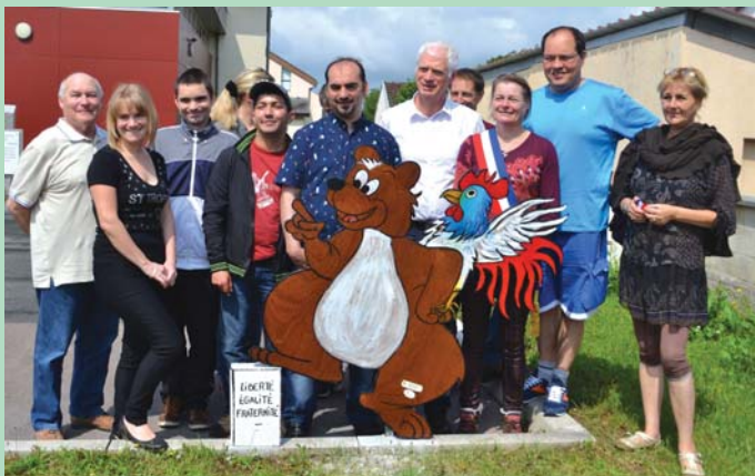
L'ours de Sésame Autisme en place près de la Mairie.

Sur la dizaine de panneaux prévus, trois ont été déjà posés dont celui de la Mairie, inauguré le 8 juin.