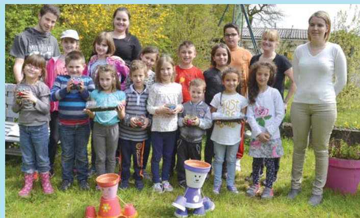
Sorties... et jardinage pour les jeunes du Centre.