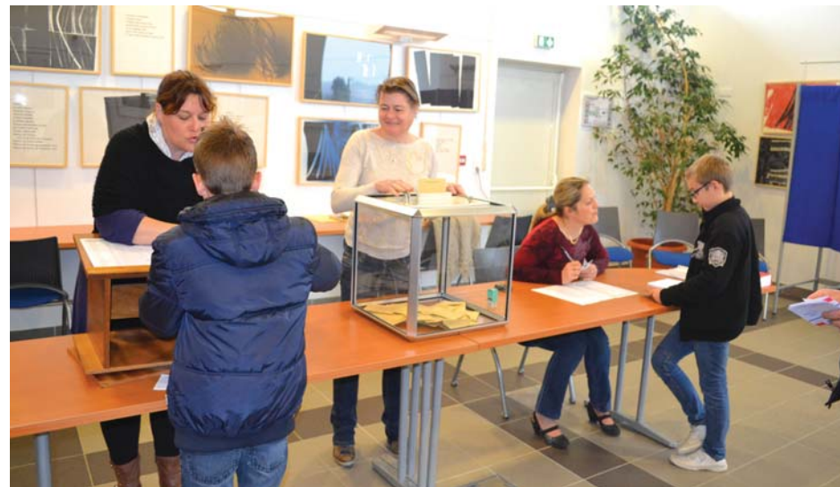
Un exercice «grandeur nature» pour les élèves !

En début de matinée, les binômes se sont adressés à leurs futurs électeurs, développant leurs projets pour