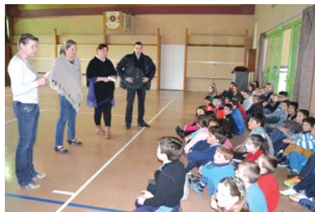
Briefing et profession de foi des «candidats» avant le début des opérations...