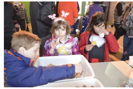
... et la dégustation des succulents beignets !