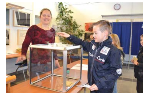
... mais avec le sourire...