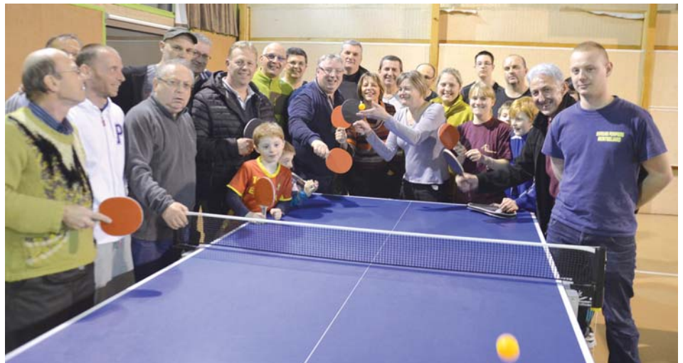
Elus et membres du club de tennis de table ont passé un bon moment ensemble.

culturelles ou humanitaires. L'occasion de cultiver des liens privilégiés avec ces acteurs essentiels de la vie communale, mais aussi de