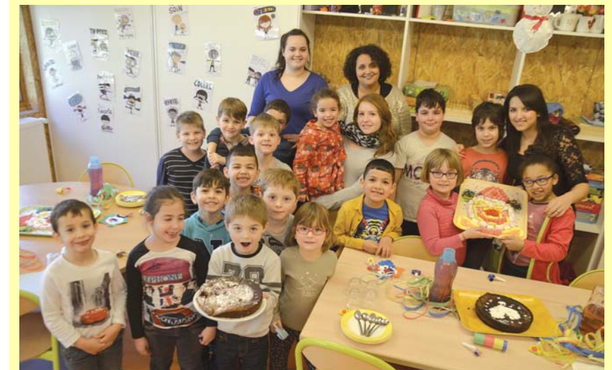
Les enfants ont attendu leurs parents pour le goûter final.

Le monde du cirque était le thème du Centre de Loisirs des Francas en février. Le dernier jour a été consacré à un grand jeu mais aussi et surtout à la réception des parents en fin de journée, avec gâteaux et plateaux de bonbons confectionnés bien évidemment sur le thème du cirque.