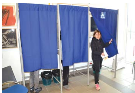
Un petit tour par l'isoloir...