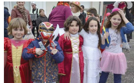
La parade des princesses...