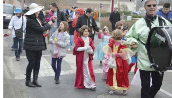
Le Carnaval a mis de l'animation dans les rues...

À l'issue de la farandole, un goûter beignets a rassemblé les Carnavaliers à la Salle polyvalente.