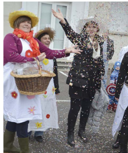
Une pluie... de confettis !

Certes, les organisateurs avaient rêvé de meilleures conditions météo pour le Carnaval annuel... Cependant, c'est sans pluie mais par une température fraîche qu'ont eu lieu les festivités le 21 mars. Petits et grands se sont retrouvés sur la place de l'école en début d'après-midi et, après la distribution des incontournables confettis, le cortège s'est mis en place pour un défilé joyeux dans les rues du village, l'animation musicale étant assurée par les «Pace'Tontons», quelques musiciens de la Vigilante d'Audincourt.