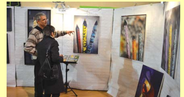
Les artistes ont aussi parlé de leur passion...