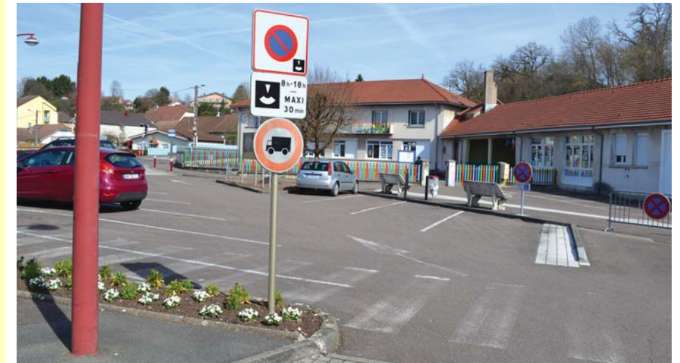
Une réflexion est actuellement menée sur le devenir du parking de l'école.

Depuis la mise en œuvre du plan Vigipirate, les places de parking ont été réduites devant l'école et cela complique une situation que les parents d'élèves déplorent depuis quelque temps déjà, bon nombre de véhicules se garant de façon parfois « anarchique », au mépris des règles de sécurité. Les élus se sont penchés sur ce problème et une intervention auprès de la SED, renforcée par le Sous-Préfet, n'a pas abouti.