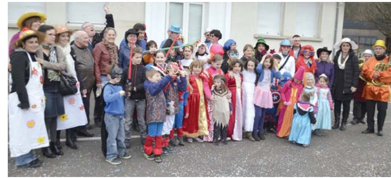
Le groupe rassemblé avec le départ du défilé.