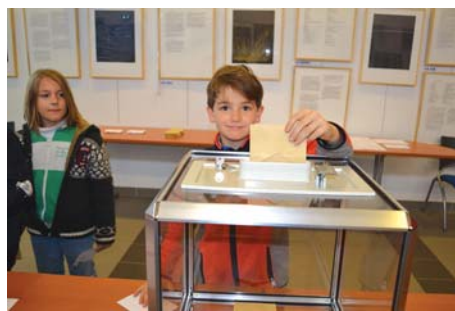
Le moment solennel...