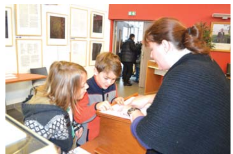
... puis la signature pour terminer !